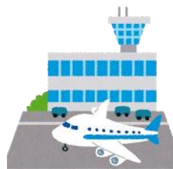
羽田空港内会議室

栄養療法に欠かせない、基本的な採血検査の読み方、習得したい方は、ぜひご参加下さい。