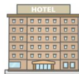
羽田エクセルホテル東急