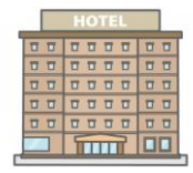
羽田エクセルホテル東急